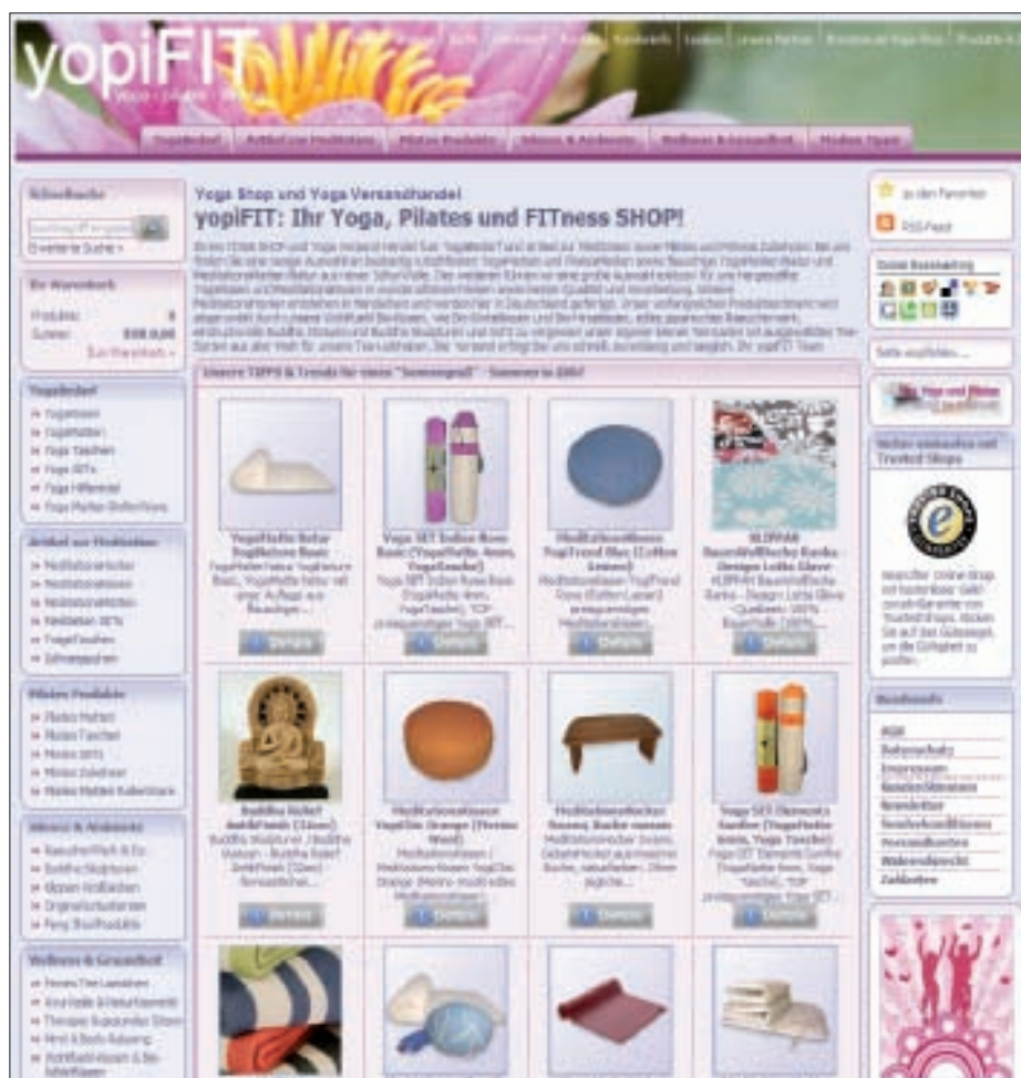
Professionelle Präsentation: Medifit-shop.com basiert auf Smartstore.biz 5.5

Die Funktionalität des Storefront wurde dann anhand eines ausgearbeiteten Fragenkatalogs an einem Referenzshop getestet. Der Referenzshop sollte weitestgehend die Standardversion nutzen und durfte vom Hersteller selbst vorgeschlagen werden. Das Budget für das Shopdesign sollte 10.000 Euro nicht übersteigen. Neben der Usability achteten die Tester auch auf Fehler, die rechtliche Folgen nach sich ziehen können.