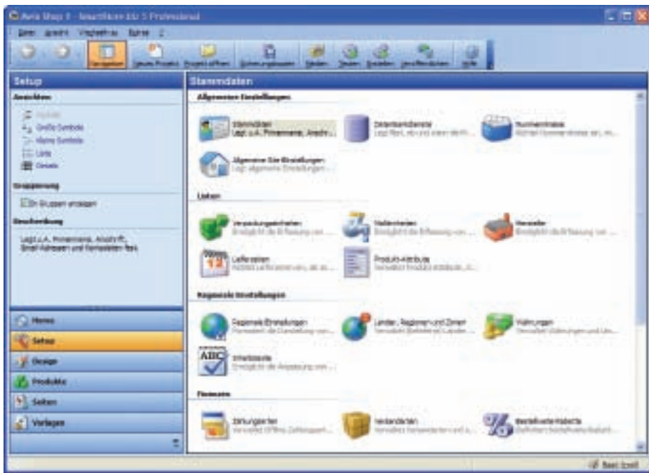
Schneller Einstieg: Die Tester loben die gute Administrationsoberfläche von Smartstore.biz 5.5