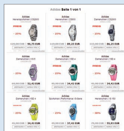
Aufgeräumt wirkt die Uhren-Präsentation

den interessierten User Klick für Klick zum Produkt führen. Die Produkte sind sehr groß dargestellt und vermitteln einen guten Eindruck. Leider gibt es immer nur eine Abbildung je Produkt. Bei diesen hochpreisigen Artikeln wären mehrere Abbildungen, eine Zoomfunktion oder eine 3-D-Animation wünschenswert. Die Produktbeschreibung ist äußerst detailliert und macht durch sehr gute Icons die einzelnen Eigenschaften transparent. Wenn die Eigenschaften aber bereits so detailliert aufgesplittet werden, könnte man auch eine Funktion dazu aufnehmen, etwa vergleichbare Uhren mit diesen Eigenschaften, die Suche nach diesen Eigenschaften, die Suche nach Filtermöglichkeiten. Die Suche erkennt Tippfehler und liefert Ergebnisse. Aber auch die Ergebnisse aus der Suche lassen sich nicht mehr sortieren oder filtern. Bei vielen Ergebnisprodukten wird der User sein Wunschprodukt kaum finden können. Der Bestellprozess ist einfach strukturiert und leicht verständlich. Kaum ein Bestellprozess in einem Shop erwies sich als so eingängig. Die Performance des Shops überzeugt. Selten haben wir einen so schnellen Shop getestet. Hier macht das Surfen und Stöbern richtig Spaß!