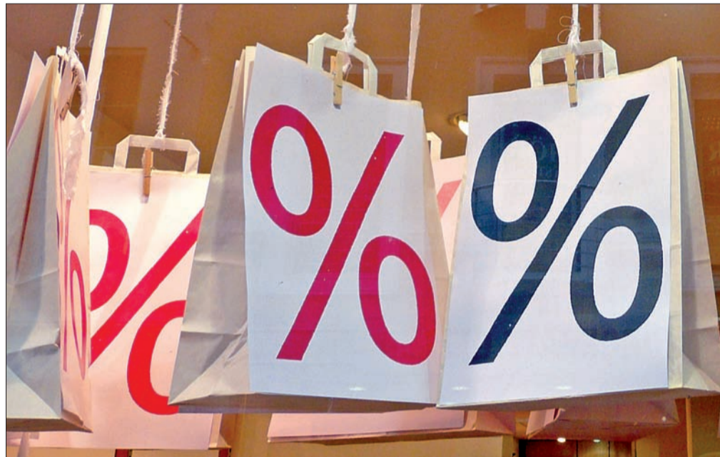
Mondo Shop 4 macht Anfängern den Einstieg leicht und bietet Experten viele Gestaltungsmöglichkeiten

Die Systemanforderungen an den Webserver sind gering, es genügt eine Infrastruktur mit PHP ab Version 5.2 und, soweit die Onlineverwaltung der Shopartikel gewünscht wird, eine MySQL-Datenbank ab Version 4.1. Die Shopsoftware unterstützt Apache „mod_rewrite“, wofür sich die Verwendung eines freien Webservers empfiehlt. Während der Installation und den ersten drei Monaten des Betriebs bietet Mondo Media kostenlosen Support. Der E-Mail-Support bleibt danach weiterhin kostenlos, telefoni-